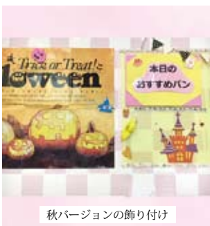
秋バージョンの飾り付け

さて、早速ですが豊科店でこの季節、新作パンや10月のイベントに向けての計画作りなど、夏よりも忙しくなってきました。夏はパンがあまり売れなくなってしまう季節ですが、逆に秋は食欲の秋ということもあってか、パンの売れ行きも良くなってきました。この機を逃さず、思わずお客様が手を伸ばしてしまうようなパンをたくさん作りたいと思っています。皆さんだけにこっそりと、どんなパンを作っているかお知らせします、まずは色々な味のあんぱんです。スイートポテト味のものなど、様々な味があります。そして見た目も楽しいデニッシュ類なども作っています。