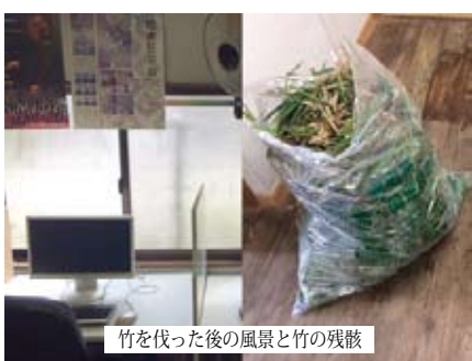
竹を伐った後の風景と竹の残骸