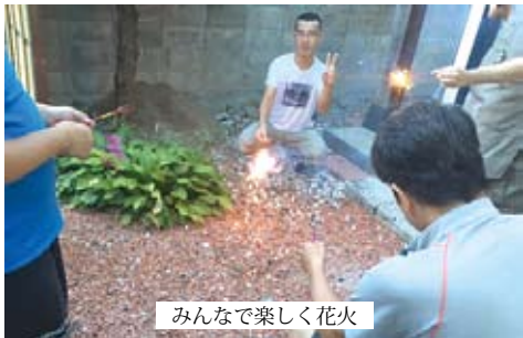
みんなで楽しく花火

貴 方の時計はどのように時を刻んでいますか？ そして、貴方はどのように時を刻みたいのですか？ ひとり一人の速さで、ひとり一人の秒針の長さで時を刻める場所、それがBeイングです。 私たちBeイングができること、それは何らかの障害をもっているとしても時代の中で、社会の中で、街の中で自分らしい生活をいとなむことのできる場所と、その鍵をお渡しすることです。