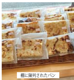
棚に陳列されたパン

有明のパン屋さんも移転の機会に、記事の内容を参考に、お客様に愛されるパン屋にしていきます。