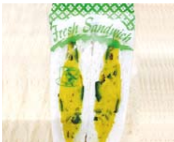
かぼちゃとクリームチーズのサンドイッチ