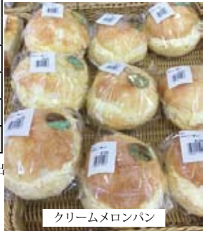
クリームメロンパン