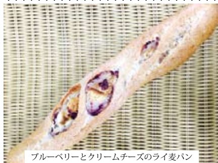
ブルーベリーとクリームチーズのライ麦パン