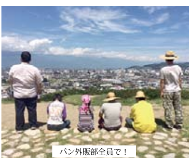
パン外販部全員で!

それと同じく、パンの外販でもスタッフだけで仕事ができるようになってきたら良いと考えています。松本外販の良いところは、一人一人が仲間を大事にするところです。これからも一生懸命に仕事をしていけるように頑張っていきたいと思えます。今年度も、松本外販部をよろしくお願います。