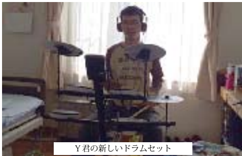
Y君の新しいドラムセット

貴 方の時計はどのように時を刻んでいますか？ そして、貴方はどのように時を刻みたいのですか？ ひとり一人の速さで、ひとり一人の秒針の長さで時を刻める場所、それがBeイングです。 私たちBeイングができること、それは何らかの障害をもっているとしても時代の中で、社会の中で、街の中で自分らしい生活をいとなむことのできる場所と、その鍵をお渡しすることです。