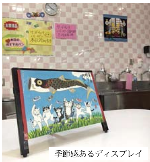
季節感あるディスプレイ

さて、豊科店で最も大きな変化といえば、新入職員が入社したということでしょう。今思うと、私も去年の今頃は希望と不安にあふれた新入職員でありました。あれから1年、私も先輩職員となり、より一層引き締めていきたいと思います。