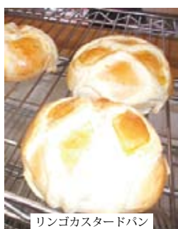
リンゴカスタードパン

就労継続A型施設有明のパン屋さんの移転が決定致しました。移転は、本年度の7月〜8月の間に完成の予定で進めています。移転場所は、ブラジルスーパーの跡地で、現在の施設の一軒南隣です。今現在は、有料駐車場を職員・外部販売車・お客様用で6台お借りしていましたが、契約解除をし、5月からは新店舗の駐車場が使用できるようになりました。後は、オープンに向けての店舗のディスプレイ・パンのカテゴリ・物量などお役様の視点に立って職員・スタッフ一丸となって検討してまいります。