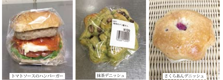
トマトソースのハンバーガー