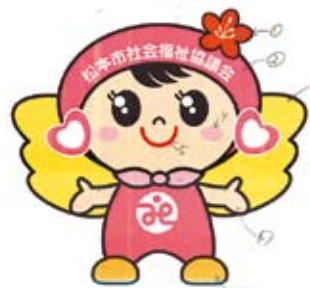
公式キャラクター「つむぎちゃん」

公式キャラクターが決定しました。今後は名刺に使われることはもちろん、着ぐるみも作成し、より福祉の活動に親近感をもってもらい、イメージアップを図るよう企画しているようです。