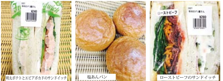
明太ポテトとエビアボカドのサンドイッチ 塩あんパン ローストビーフのサンドイッチ

※上記は、主要な外部販売先です。イベント等にも出店することが出来ますので、お気軽にお電話ください。 連絡先：電話：0263-88-3307 担当：丸山