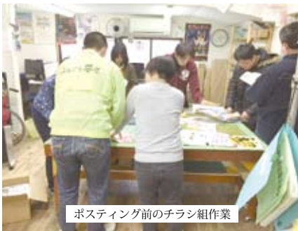
ポステイング前のチラシ組作業

やりがいも感じてくれるようになってくれたのか、メンバーの中にはN君など、「今日はポステイングはありますか」と毎日のように聞いてくれるようになりました。