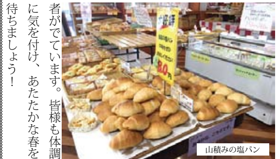
山積み塩あんパン

さて豊科店では、年末年始の忙しさが嘘のように、ゆったりとした時間が流れていきます。と言いますのも、1月の忙しい時が終わったというのもありますが、新しいスタッフさんが豊科店に来て下さっているのが大きいと思っております。様々な理由で夢トライを利用してはいるスタッフさんですが、様々なことに挑戦していただき、日に日に自信に満ちた日になっていくのを感じます。また、一人では困難なことでも、集団になることにより、できるようになるのもあらためて感じました。職員がスタッフを支え、スタッフが職員を支えてくれているんだなあと感じます。時間にゆとりがある分、それをスタッフのため、パン屋さんのためを使い、よりよい理想づくりにしていこうと思う、3月の豊科店であります。 最後に豊科店でもインフルエンザや体調不良による休業