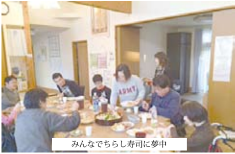
みんなでちらし寿司に夢中

貴 方の時計はどのように時を刻んでいますか？ そして、貴方はどのように時を刻みたいのですか？ ひとり一人の速さで、ひとり一人の秒針の長さで時を刻める場所、それがBeイングです。 私たちBeイングができること、それは何らかの障害をもっているとしても時代の中で、社会の中で、街の中で自分らしい生活をいとなむことのできる場所と、その鍵をお渡しすることです。