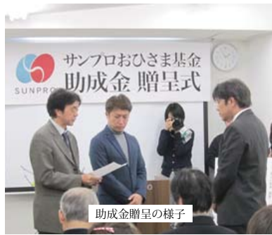
助成金贈呈の様子

のポイント数に応じて助成金が支払われる仕組みです。投票数は564件で、2000名を超えるお客様がこれら団体の活動に触れていただいたことになりました。