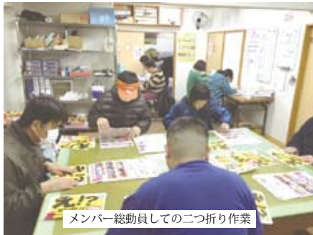
メンバー総動員しての二つ折り作業

メンバーが一日中参加できる水曜日には惣社地区や里山辺地区のそれぞれの区画を1日で終わらせるなど、ポステイングに慣れてきたこともあり、以前に比べるとチーム分けをして、手際よくできるようなってきました。