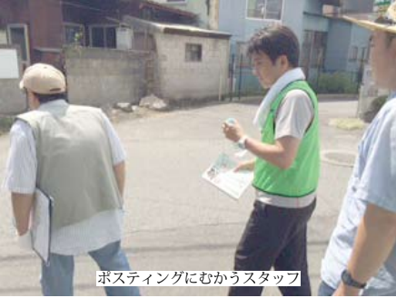
ポスティングにむかうスタッフ

この様な仕事を始めたのは6月の事になります。最初は情報誌「みるとく」を事務所のある清水2丁目地区の1軒1軒の家屋や集合住宅のポストへ配布する事から始まりました。