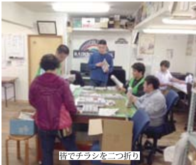
皆でチラシを二つ折り

また、ポスティングだけでなくチラシ折りや封筒への封入作業も入ってくるようになり、最初はチラシ折り8000枚から、現在では最大で28000枚を任せられるようになってきました。DTP班だけでは間に合わず、松本外販部や農業班の人手を借りながら、何とかこなせるようになりました。