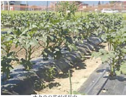
オクラの花が成長中

今、ふれあい農園の圃場③には、60株程のオクラの収穫期となり美しいオクラの花が次々と咲いています。