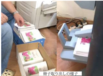
冊子取り出しの様子

ただ、ページ数36P、部数220冊という分量は印刷に時間がかかり、印刷開始からすべて終えるまでプリンターが動きおしで4時間はかかりました。