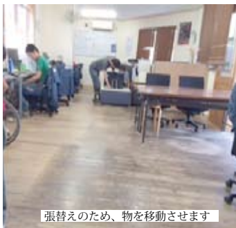
張替えのため、物を移動させます