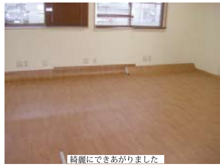
綺麗にできあがりしました

一面一面、丁寧に板目に合わせて張り替えていきます。張り替えた板の色は、従来の茶色い板から、温かみのある赤オレンジ色の板に変更しました。隙間ができないようにぴったりになるように、敷き詰めました。ギリギリのラインまで作業します。