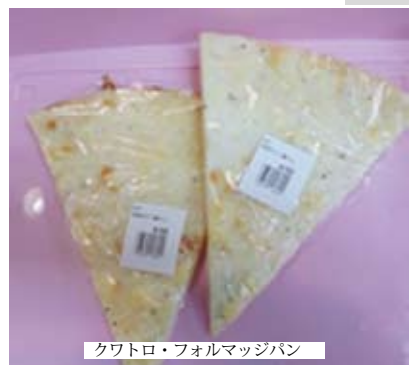
クワトロ・フォルマッジパン