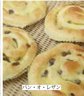
パン・オ・レザン