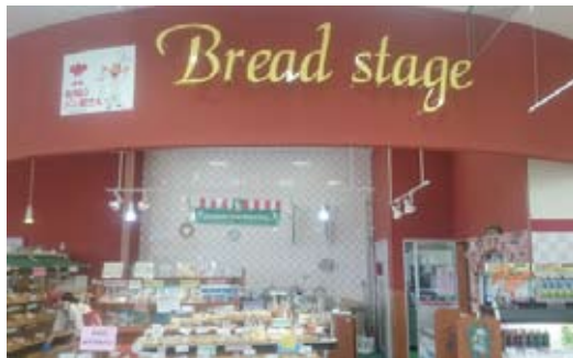
豊科 COOP 店内