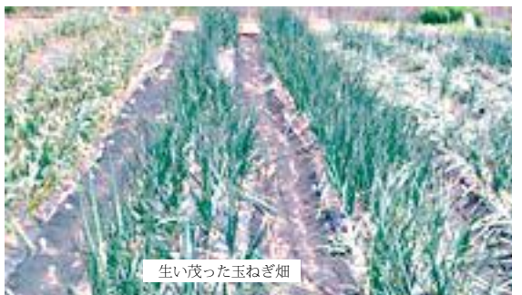
生い茂った玉ねぎ畑