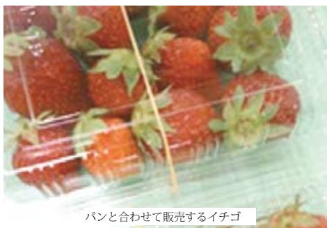
パンと合わせて販売するイチゴ

いても、製造側と販売側とで良く話し合いをし、どの商品が売れて、売れない商品はなぜか？売れない商品は、なぜ売れないのか？話し合いをして居ります。日々、売れ残ってしまった商品を確認し、必要に応じては、日々話し合いをするようにしています。これから、夏の商品開発に向け、お客様に喜ばれるパンを、提供して行きたいと思っております。