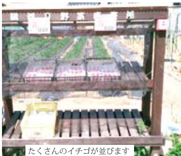
たくさんのイチゴが並びます

今日は圃場2イチゴの収穫と直売所に出しました。最初はそんなに採れないと思いましたが、しかし、採っていくうちに思ったより収穫しました。全部で90個、イチゴが採れました。鳥に食べられなくて良かったです。直売所に出しました。1パック、100円です。買ってください。よろしくお願いたします。