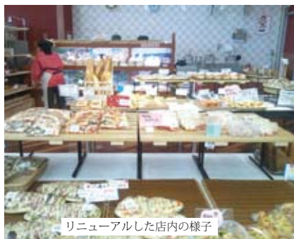
リニューアルした店内の様子

緑が鮮やかな季節になり、時折初夏の兆しが出すようになってきました。気温の変化に伴って、お客様が手に取るパンの種類も変わってきます。来店して下さるお客様のニーズに合うパンを、職員、スタッフとも試行錯誤する日々です。 さて、豊科店では5月に店内の改装が行われました。以前よりも明るく広さを感じる店内となり、気持ちも改まりました。店内の棚やテーブル、パンの配置などほんのことが変わり、初めは戸惑うスタッフの姿もありましたが、徐々に対応できています。そして、リニューアルの際には「世界のパンフェア」を実施しました。マラサダ、バタークーヘンといった普段聞き慣れないよ