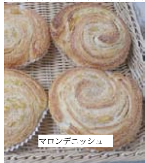
マロンデニッシュ