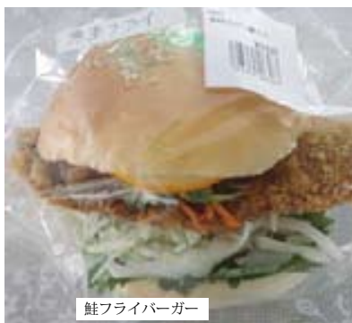
鮭フライバーガー

り、週に一度販売に参加して、週に一度販売に参加して、週に一度販売に参加して... (text continues with details about the external sales team and their efforts to expand their reach).